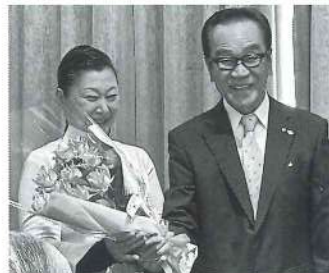
【長谷川前会長と山内会頭】