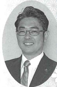
高石市長 畑中 政昭