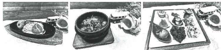
目玉焼き乗せハンバーグ 麻婆豆腐 9割プレート